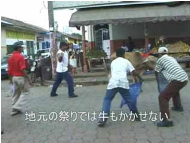
地元の祭りでは牛もかかせない