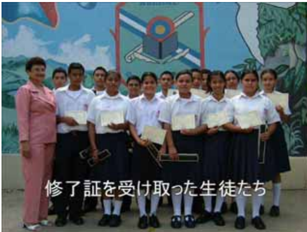
修了証を受け取った生徒たち