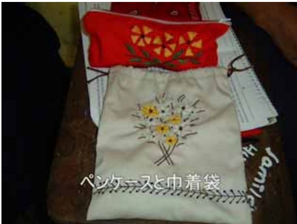
ペンケースと巾着袋