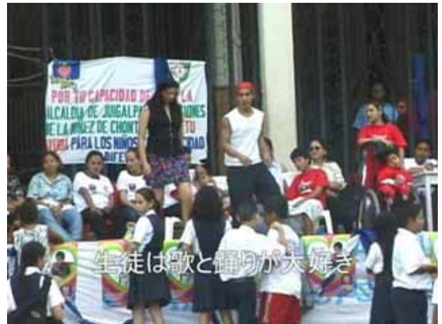
生徒は歌と踊りが大好き