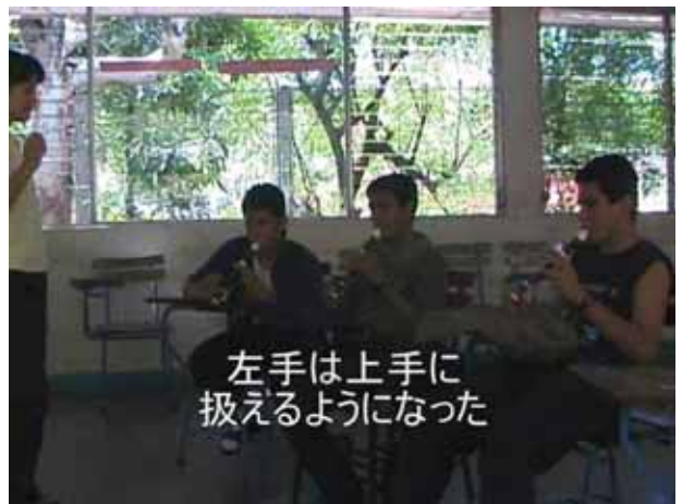
左手は上手に 扱えるようになった