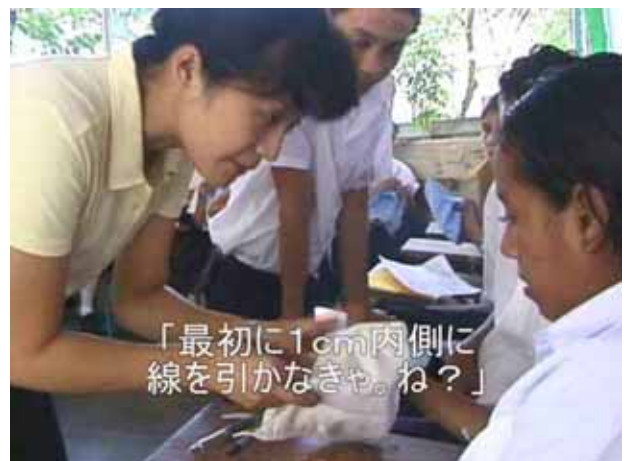
「最初に1cm内側に 線を引かなきゃね？」