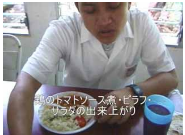
鶏のトマトソース煮・ピラフ・サラダの出来上がり