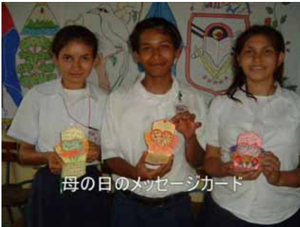
母の日のメッセージカード