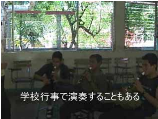
学校行事で演奏することもある