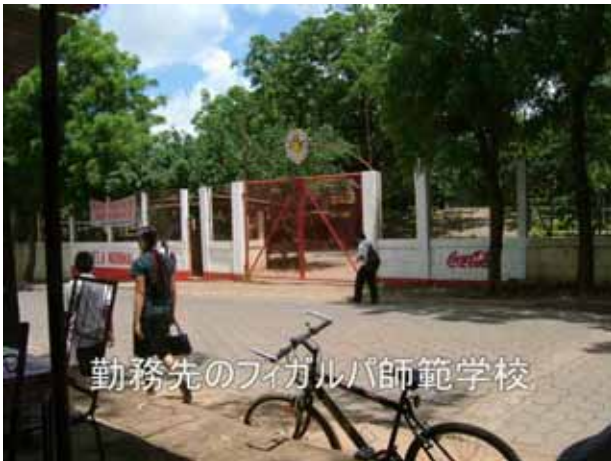
勤務先のフィガルバ師範学校