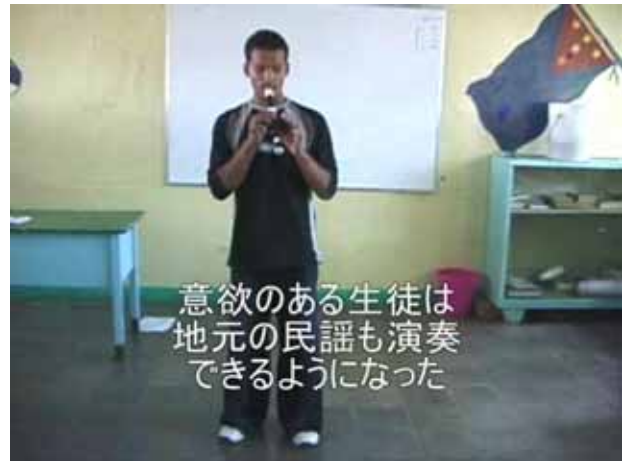
意欲のある生徒は 地元の民謡も演奏 できるようになった