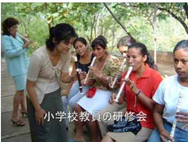
小学校教員の研修会