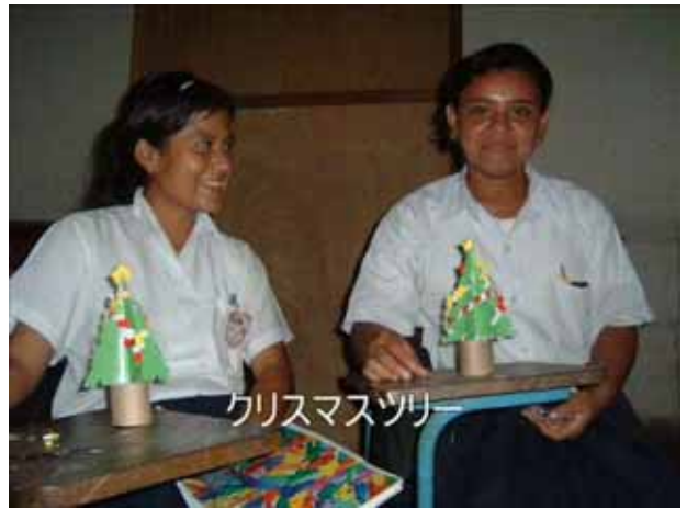
クリスマスツリー