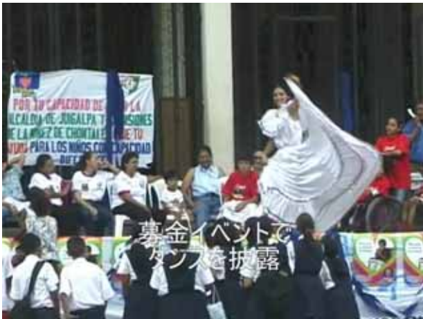
募金イベントでダンスを披露