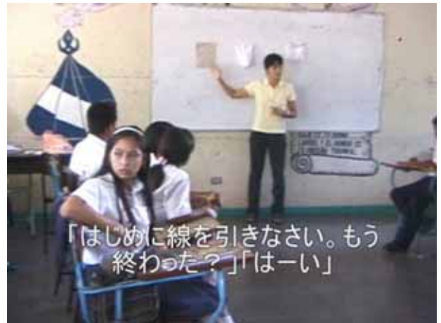
「はじめに線を引きなさい。もう 終わった？」「はい」