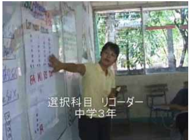
選択科目 リコーダー 中学3年