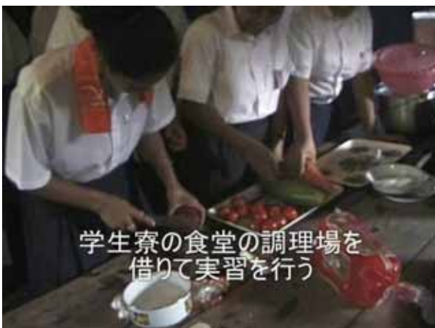
学生寮の食堂の調理場を借りて実習を行う