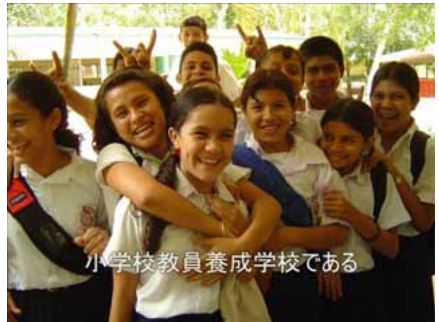
小学校教員養成学校である