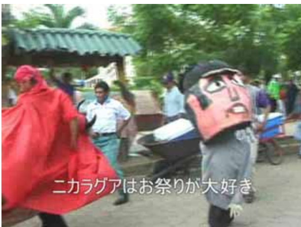
ニカラグアはお祭りが大好き

発表ではDV(デジタルビデオ)も用いられました。この6ページ分の資料は、DV画面をもとにスライド風に編集しなおしたものです。