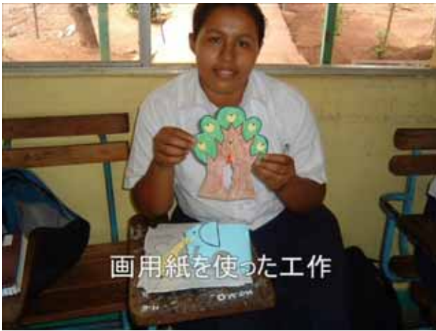
画用紙を使った工作