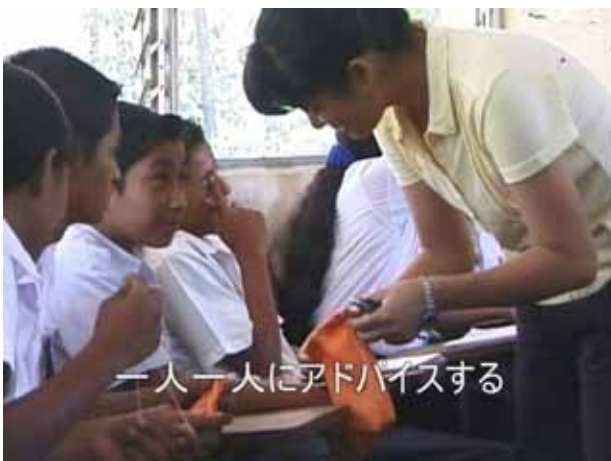
一人一人にアドバイスする