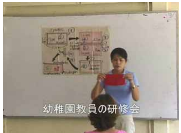
幼稚園教員の研修会