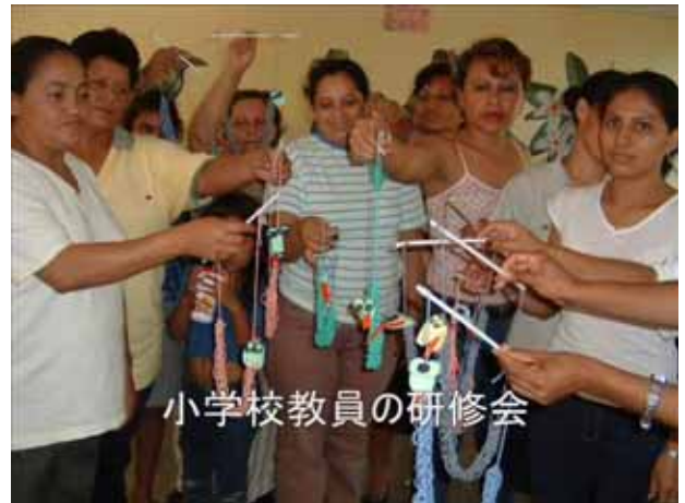
小学校教員の研修会