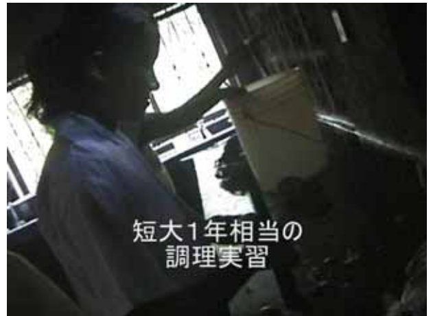
短大1年相当の調理実習