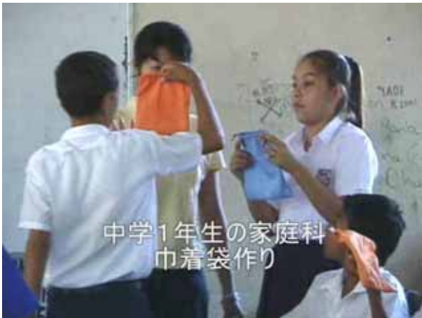
中学1年生の家庭科 巾着袋作り