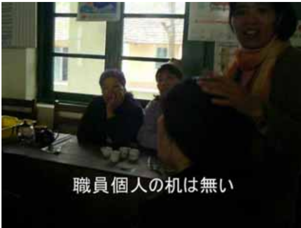
職員個人の机は無い