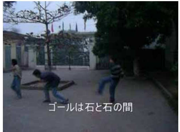
ゴールは石と石の間