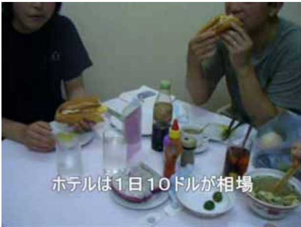
ホテルは1日10ドルが相場