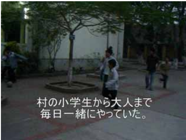
村の小学生から大人まで 毎日一緒にやっていた。