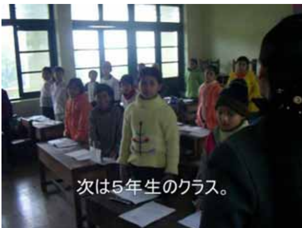
次は5年生のクラス。