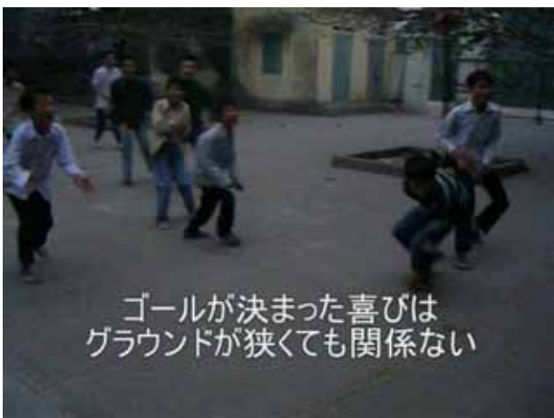
ゴールが決まった喜びは グラウンドが狭くても関係ない