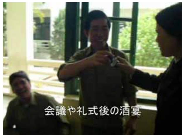
会議や礼式後の酒宴