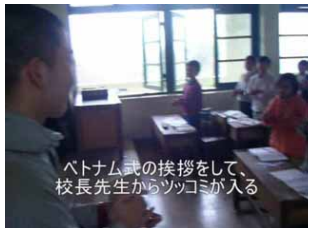
ベトナム式の挨拶をして、 校長先生からツッコミが入る