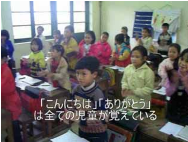
「こんにちは」「ありがとう」 は全ての児童が覚えている