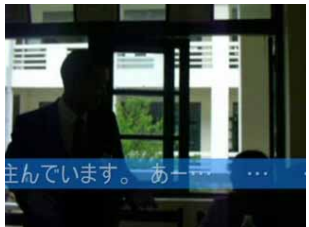
主んでいます。あー… …