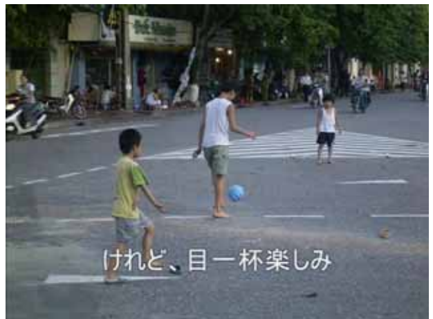
けれど、目一杯楽しみ