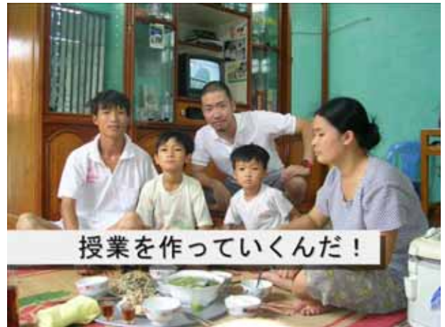
授業を作っていくんだ!