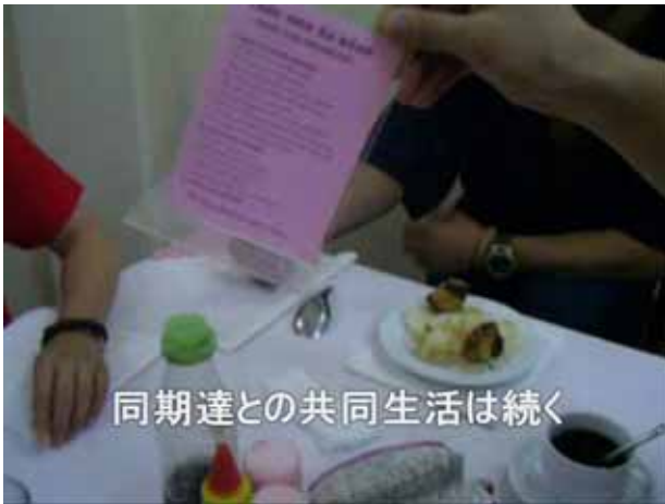
同期達との共同生活は続く