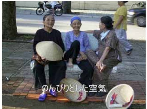
のんびりとした空気