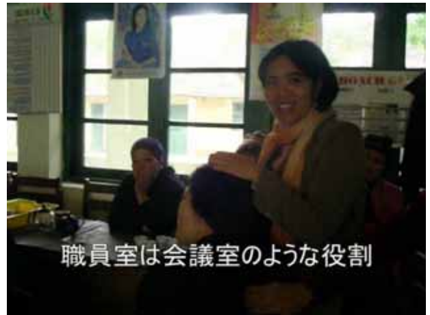
職員室は会議室のような役割