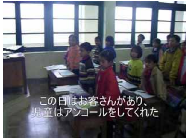
この日はお客さんがあり、 児童はアンコールをしてくれた