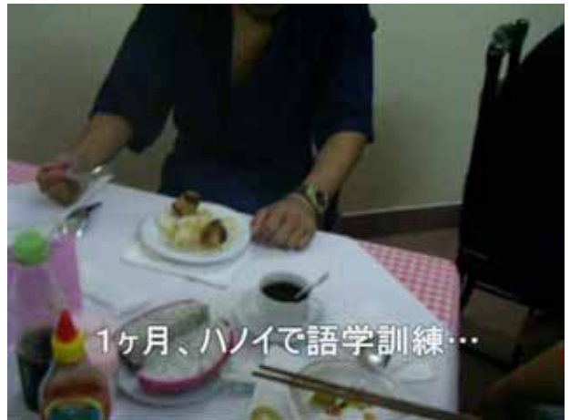
1ヶ月、ハノイで語学訓練...