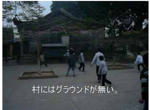
村にはグラウンドが無い。