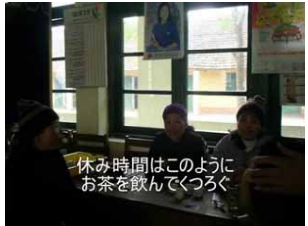
休み時間はこのように お茶を飲んでくつろぐ