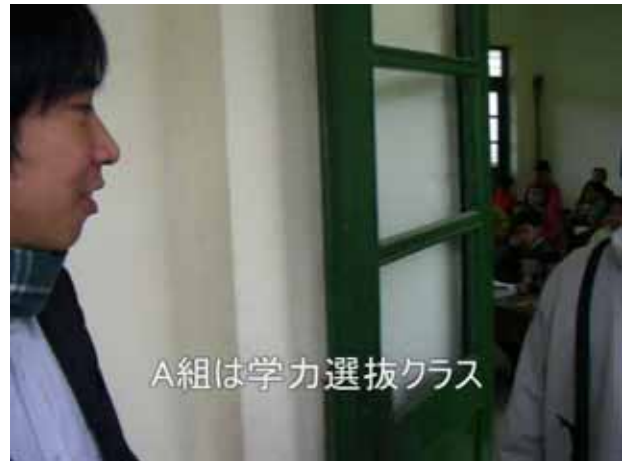
A組は学力選抜クラス