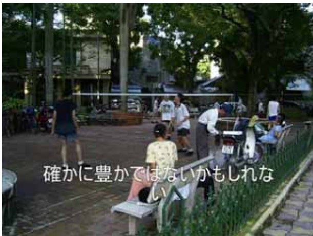
確かに豊かではないかもしれな い