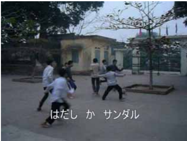
はだし か サンダル