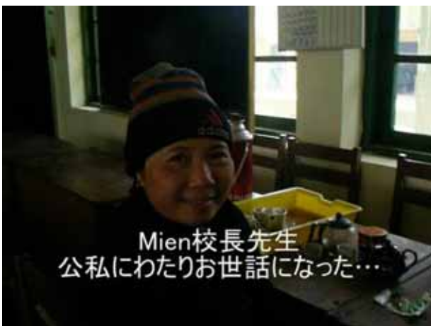
Mien校長先生 公私にわたりお世話になった…