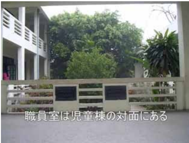
職員室は児童棟の対面にある