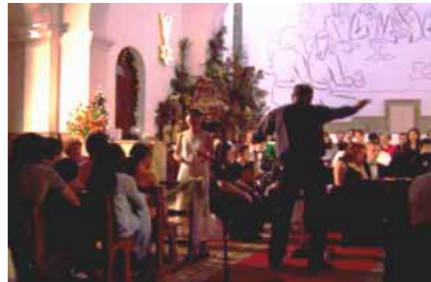
クリスマスコンサートに呼ばれてソロを歌った(VTR)