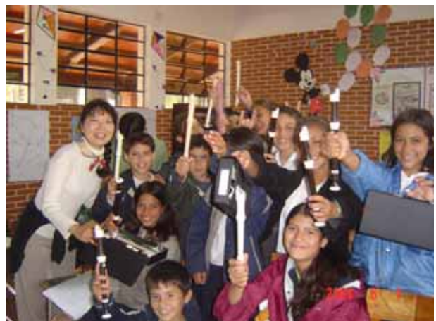
日本から贈られてきた楽器とともに・6年生