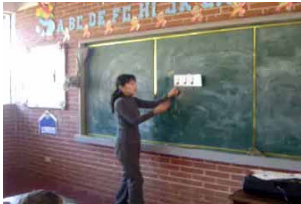
小学校1年の音楽授業の様子(VTR)