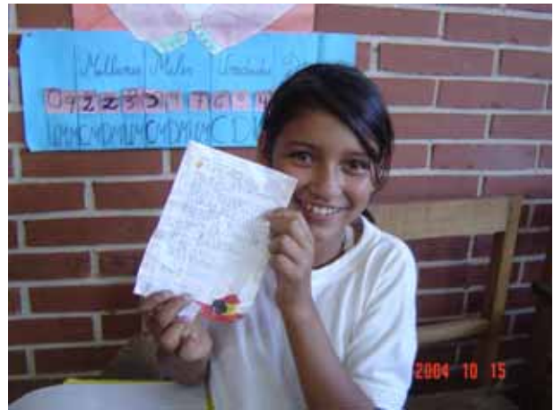
お礼の手紙をもらって喜ぶ5年生