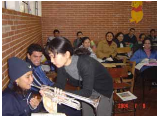
自分のトランペットを生徒に紹介