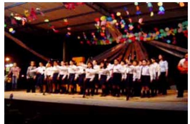
合唱団を作った / 合唱団の練習 / 合唱団本番 (VTR)