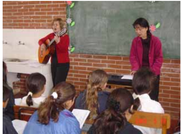
カウンターパートと合唱の授業