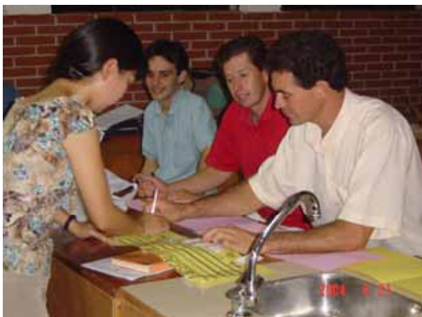
先生のための音楽教授法講座