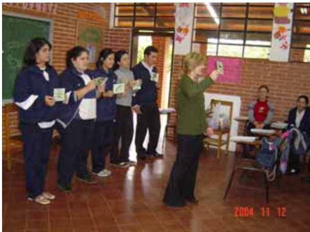
私の紹介したカードを使ってカウンターパートが授業