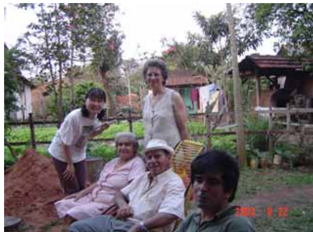
人々はのんびりしている