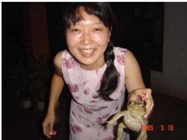
時期になるとひきがえるがたくさん出没