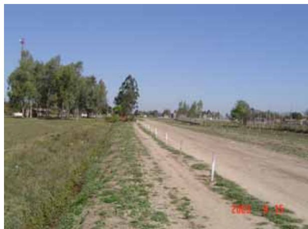
任地コロネルボガード