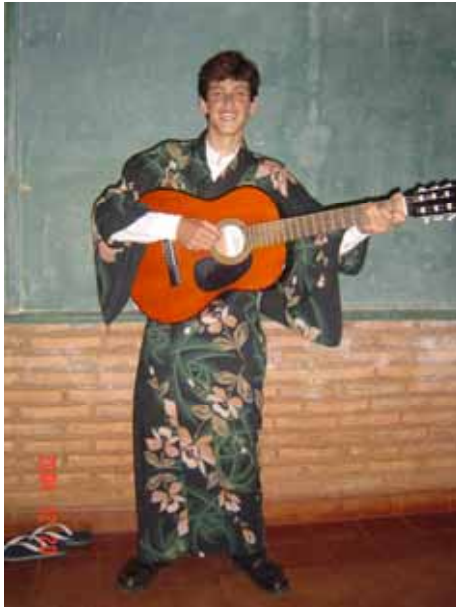
浴衣を着てはしゃぐ音楽仲間