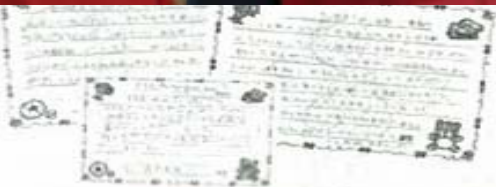
松原小学校の児童から JICA に届 いたお礼状